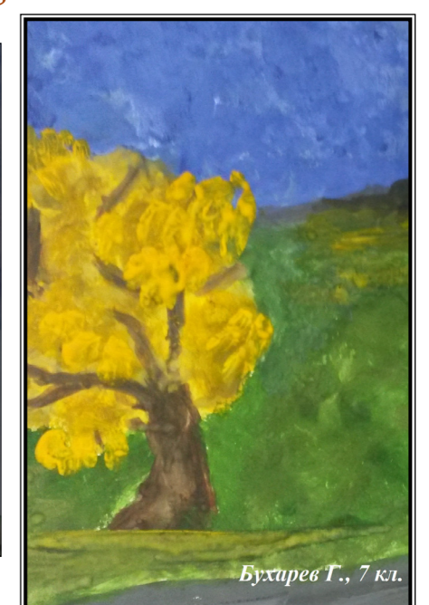
Бухарев Т., 7 кл.